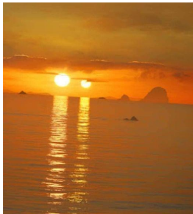
Le signe des Gémeaux : Johfra Photo : Les deux Soleils : internet

Le Guide du jour nous dit... « Je vous redonne la mémoire de la Lumière, la mémoire du jour où vous avez accepté l'incarnation pour retrouver la Lumière encore plus loin au fond de la Matière... »